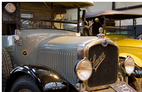
Oldtimer Fahrzeuge von Saurer Museum Arbon und arbon classics

Für alle Miniatur-Fans: Es werden verschiedene Schiffsmodelle des Schiffsmodellern Clubs Goldach ausgestellt (Tipp: Unser Favorit ist die MF Romanshorn). Der Fotoclub Romanshorn zeigt die besondere Sammlung «The Beauty of Waste». Für Oldtimer-Fans sehen Sie Oldtimer des Saurer Museum und arbon classics. Zudem findet eine spezielle Ausstellung, «Unser See - Romanshorn Leben und Arbeiten am See» ergänzt mit Modellen von historischen Bodensee-Schiffen im Museum Hafen Romanshorn, statt.