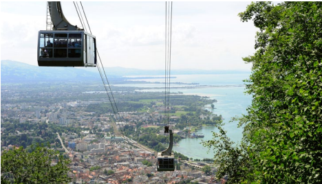
Pfänder. Der Berg am Bodensee (1064 m)