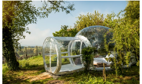
Bubble-Hotel von Thurgau Tourismus

- Day Spa Gutscheine von La Val Hotel & Spa Brigels, Food Trail Tickets und Krimidinner auf dem Bodensee, sowie ein Essensgutschein vom Ristorante PORTO.