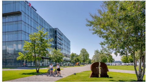
Skulpturengarten, Forum Würth Rorschach