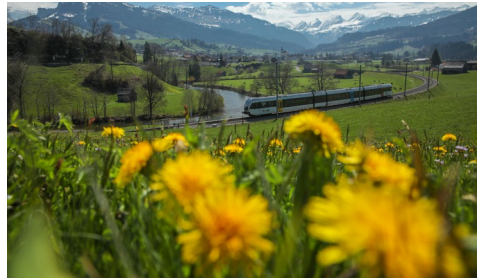
Unterwegs mit dem Thurbo im Frühling